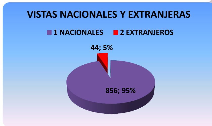
Gráfico # 3. Visitas Nacionales y Extranjeras.

EN LO QUE CORRESPONDE A LAS VISITAS NACIONALES Y EXTRANJERAS EN EL PRIMER TRIMESTRE DEL AÑO 2020, INGRESARON EL MUSEO PALEONTOLÓGICO MEGATERIO, 856 VISITAS NACIONALES (95,11%), MIENTRAS QUE INGRESARON 44 VISITAS EXTRANJERAS (4,89%) DE ACUERDO A LAS ESTADÍSTICAS.