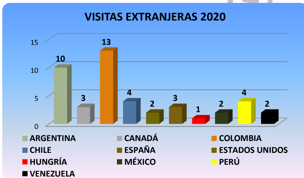
Gráfico # 4. Visitas Extranjeras por Países.

DE ACUERDO A LAS ESTADÍSTICAS EN EL PRIMER TRIMESTRE DEL AÑO 2020 LA MAYOR AFLUENCIA DE VISITANTES EXTRANJEROS PROCEDEN DE COLOMBIA (13) Y ARGENTINA (10) , RECIBIENDO VISITAS DE 10 PAÍSES DISTINTOS. POSTERIOR A ESTOS MESES NO SE RECIBIÓ VISITAS PRESENCIALES Y EN EL MES DE JULIO SE INICIARON LAS TELEGUIANZAS DEL MUSEO PALEONTOLÓGICO MEGATERIO.