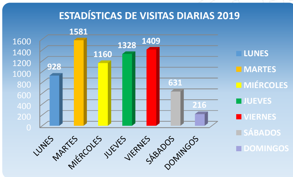
Gráfico # 2. Visitas diarias al museo.

EN LO QUE RESPECTA A LAS VISITAS DIARIAS AL MUSEO EN EL AÑO 2019, LOS DÍAS DE MAYOR AFLUENCIA FUERON LOS SIGUIENTES: MARTES 1581 PERSONAS (21,80%), JUEVES 1328 PERSONAS (18,31%), Y VIERNES 1409 PERSONAS (19,43%), MIENTRAS QUE LOS DOMINGOS INGRESARON 216 PERSONAS (2,98%), QUE CORRESPONDE A LOS DÍAS DE MENOR AFLUENCIA DE ACUERDO A LAS ESTADÍSTICAS.