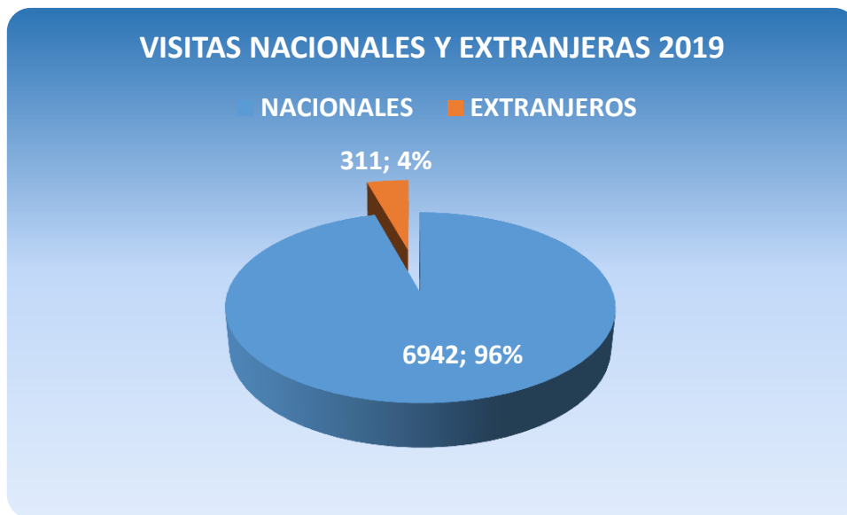
Gráfico # 3. Visitas Nacionales y Extranjeras.

EN LO QUE CORRESPONDE A LAS VISITAS NACIONALES Y EXTRANJERAS EN EL AÑO 2019, INGRESARON EL MUSEO PALEONTOLÓGICO MEGATERIO, 6942 VISITAS NACIONALES (95,71%), MIENTRAS QUE INGRESARON 311 VISITAS EXTRANJERAS (4,29%) DE ACUERDO A LAS ESTADÍSTICAS.